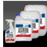
GO Cleaner - Flüssigkeit zum Waschen und Reinigen von Werkzeugen und Maschinen