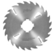
Längsschnittkreissägeblätter MULTIX PRO Standard (4M) für Schneiden vom Frischholz mit Vielblattkreissägen.