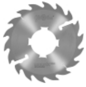
Längsschnittkreissägeblätter MULTIX PRO Standard (2M) für Schneiden vom Frischholz mit Vielblattkreissägen.