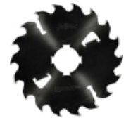
Längsschnittkreissägeblätter MULTIX PRO Plus (4M) für Schneiden vom Frischholz mit hochleistungsfähigen Vielblattkreissägen.