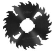
Längsschnittkreissägeblätter MULTIX PRO Twin (4M) für Schneiden vom Frischholz mit Vielblattkreissägen.