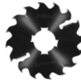
Längsschnittkreissägeblätter MULTIX PRO Plus (2M) für Schneiden vom Frischholz mit hochleistungsfähigen Vielblattkreissägen.