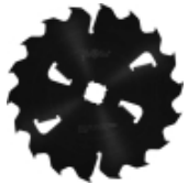
Längsschnittkreissägeblätter MULTIX PRO Plus (6M) für Schneiden vom Frischholz mit hochleistungsfähigen Vielblattkreissägen.